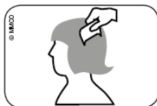
Imagem: Passar o cabelo molhado a pente fino, com um pente para piolhos, da raiz até à ponta dos cabelos.